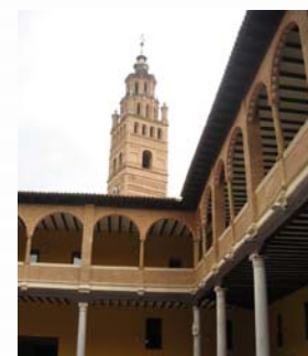
Palacio de Eguarás