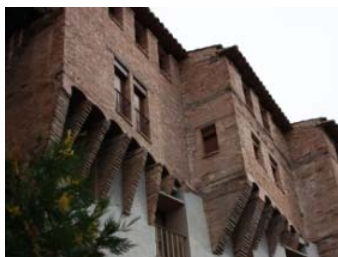
Judería (Casas Colgadas)

Duración: 2'5 horas. Precio: 175 € Incluye entradas al Palacio Episcopal y a las tres iglesias.