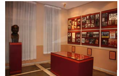
Teatro Bellas Artes