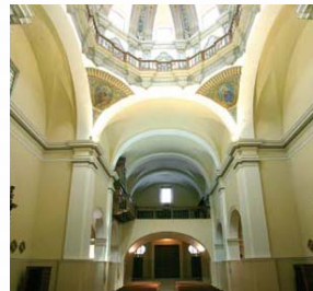
Iglesia Ntra. Sra. de la Merced