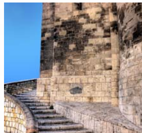
Iglesia de Sta. M a Magdalena