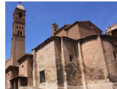
Iglesia Sta. M a Magdalena