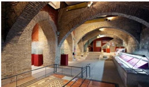
Palacio Episcopal (Exposición de Arqueología)

El tiempo de estancia máximo en cada uno de estos monumentos será de una hora, respetando los horarios de apertura y cierre.