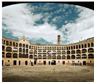
Plaza de Toros Vieja