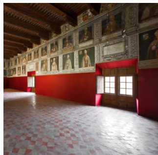
Palacio Episcopal (Salón de Obispos)

Duración: 2´5 horas. Precio: 150 €. Incluye entradas a tres interiores.