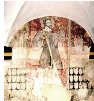
Claustro de San Francisco